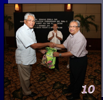
Minggu Alam Sekitar 2010