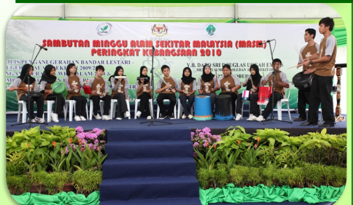
Persembahan hebat daripada barangan terpakai oleh pelajar daripada SMK Jelutong.