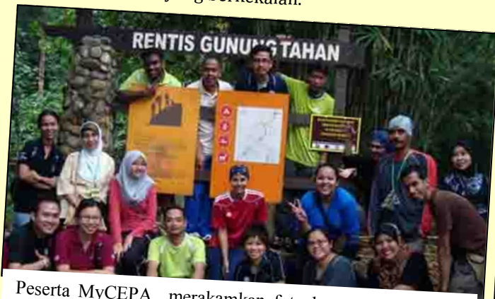
Peserta MyCEPA merakamkan foto kenangan di Rentis Gunung Tahan, selepas selesai mengadakan aktiviti Jugle Tracking di Taman Negara Merapoh, Taman Negara, Merapoh.

pengalaman yang berkaitan. Bengkel ini juga dapat menghimpunkan idea-idea dari para peserta agar program NRE akan dilaksanakan dengan lebih bersepadu dan berkesan, serta sampai tepat kepada golongan sasaran. Dan diharapkan agar bengkel ini merupakan satu titik tolak yang memulakan aktiviti kesedaran yang mantap bagi menjamin alam sekitar yang berkekalan.