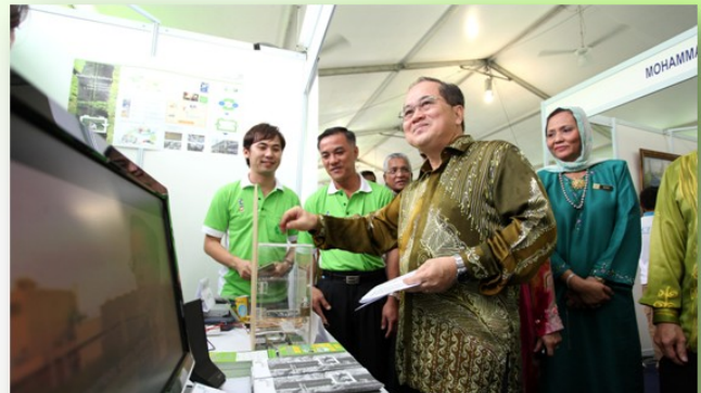
YB Dato Sri Douglas Uggah Embas meluangkan masa beliau melawat pameran dan kempen kesedaran E-Waste.