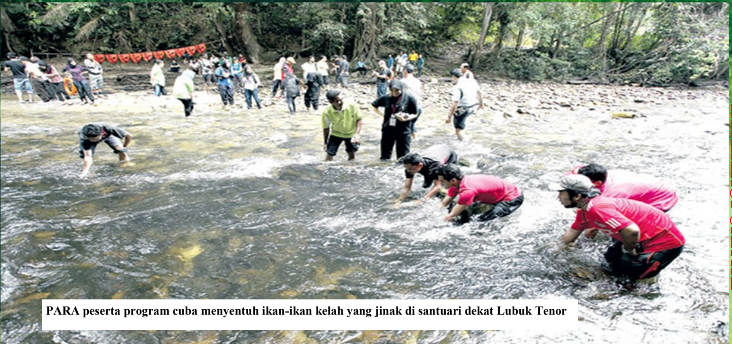
PARA peserta program cuba menyentuh ikan-ikan kelah yang jinak di santuari dekat Lubuk Tenor

Dalam pada itu, ikan kelah yang mendapat jolokan Raja Sungai mempunyai isi yang enak sehingga sisiknya boleh digoreng dan dimakan seperti keropok menyebabkan harga bagi sekilogram kelah boleh mencapai ribuan ringgit.